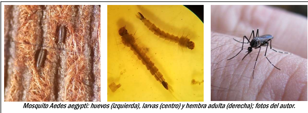
Mosquito Aedes aegypti: huevos (izquierda), larvas (centro) y hembra adulta (derecha); fotos del autor.

El mosquito que transmite dengue, el Aedes aegypti , es un insecto urbano y doméstico, lo que significa que está en estrecha relación con las personas. Encuentra en nuestros comercios, hogares, patios y jardines todas las condiciones necesarias para desarrollarse.