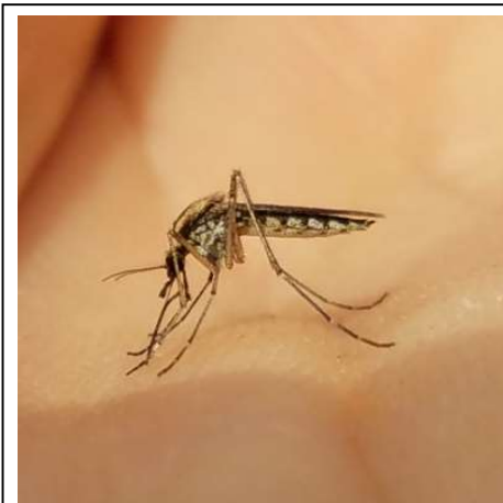
El mosquito que nos molesta en los grandes espacios verdes de Tandil: el Aedes albifasciatus. Este mosquito se cría en los charcos de lluvia y NO transmite dengue.