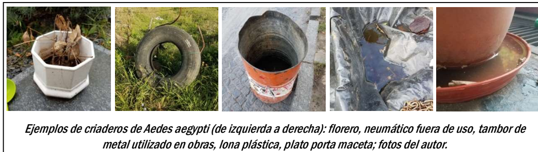
Ejemplos de criaderos de Aedes aegypti (de izquierda a derecha): florero, neumático fuera de uso, tambor de metal utilizado en obras, lona plástica, plato porta maceta; fotos del autor.

los huevos quedan sumergidos y eclosionan. A partir de ahí, comienza el desarrollo de las larvas y unos días después saldrán los adultos, que suelen volar desde unos pocos hasta unos cientos de metros. Únicamente las hembras son las que chupan sangre y transmiten enfermedades. Este mosquito nunca lo vamos a encontrar criando en diques, lagos, arroyos, charcos de lluvia o zanjas.